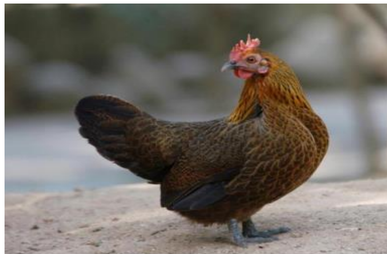
الدجاج Gallus domesticus